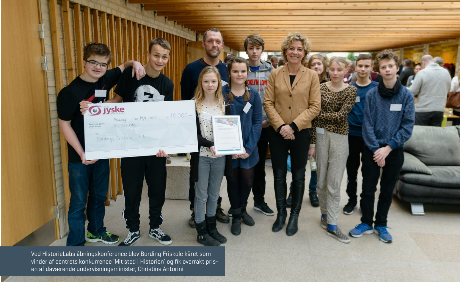
Ved HistorieLabs åbningskonference blev Bording Friskole kåret som vinder af centrets konkurrence 'Mit sted i Historien' og fik overrakt prisen af daværende undervisningsminister, Christine Antorini

ler i form af et rollespil og to grundlovsgeneratorer. Desuden udgav centret i 2014 et læremiddel om skolehistorie i anledning af folkeskolens 200 års jubilæum og udviklede herudover inspirationskasser til undervisning i samarbejde med UC-SYD. Læremidlerne er blevet bestilt i klassesæt til over 100 skoler over hele landet.