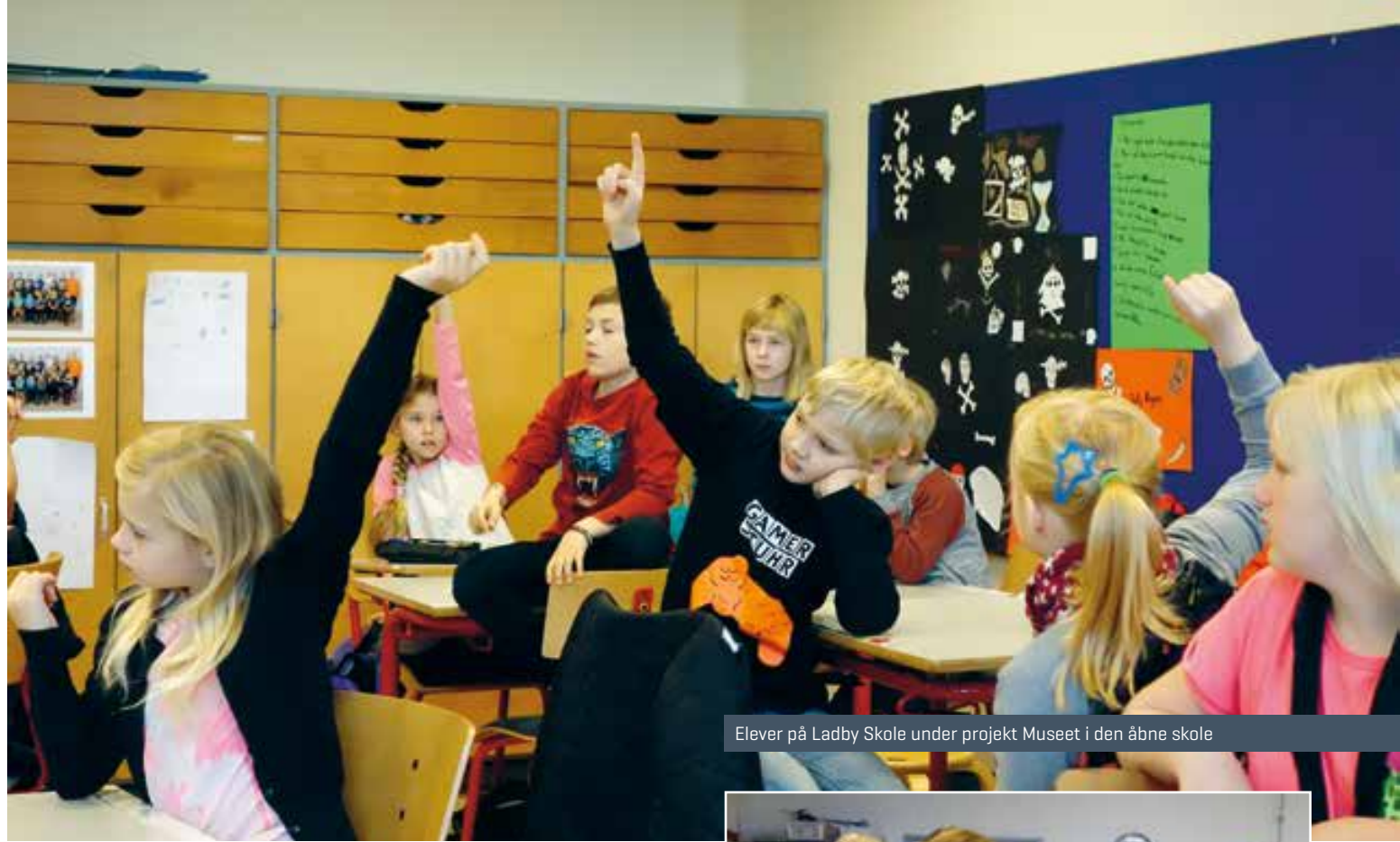
Elever på Ladby Skole under projekt Museet i den åbne skole