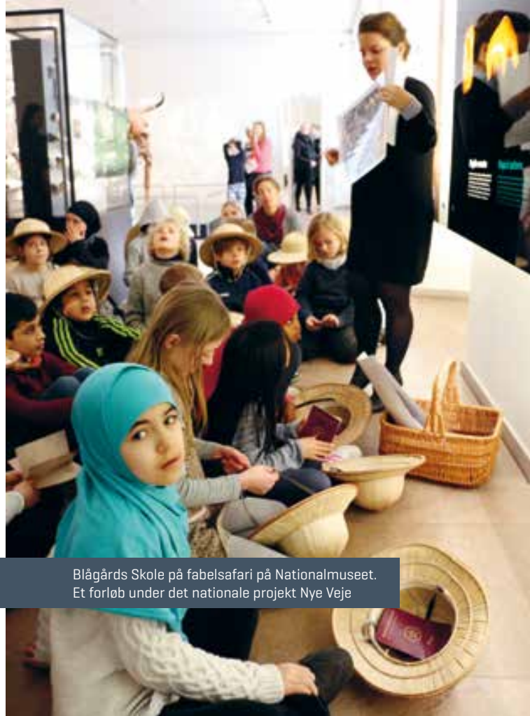
Blågårds Skole på fabelsafari på Nationalmuseet. Et forløb under det nationale projekt Nye Veje

Programmet Skole og kulturarv har i 2016 styrket fokus på at inddrage studerende på professionsuddannelserne, herunder især læreruddannelsen og dennes mulighed for at samarbejde med omverdenen under uddannelsen. HistorieLab har for eksempel i relation til reformationsjubilæet i 2017 afviklet samarbejde mellem studerende og kulturinstitutioner, hvor de studerende har udviklet undervisningsforløb i efteråret 2016, og de studerendes videre arbejde med dette i form af afprøvning, evaluering og aktionsforskning fortsætter i 2017.