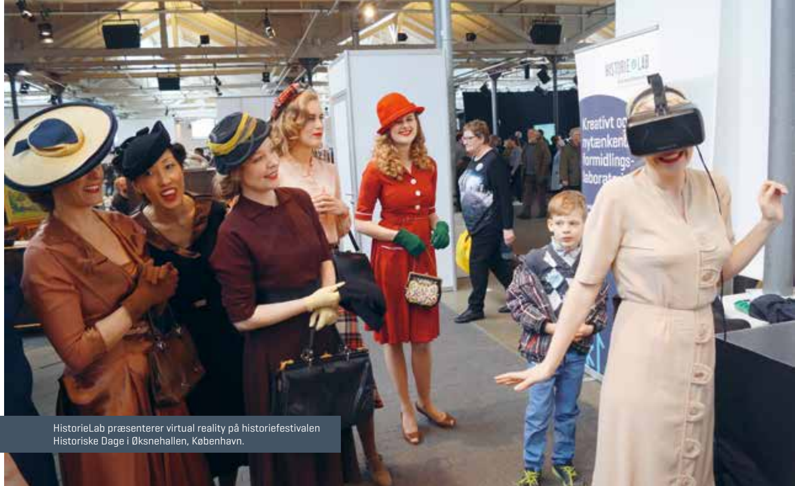
HistorieLab præsenterer virtual reality på historiefestivalen Historiske Dage i Øksnehallen, København.