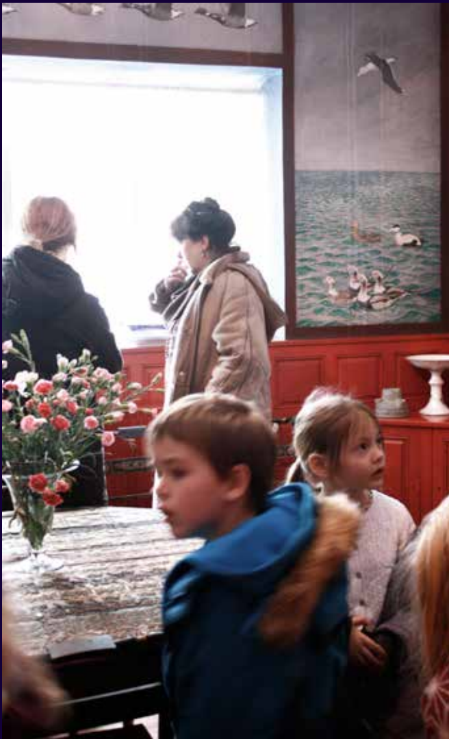
Daginstitutionbesøg på Johannes Larsen Museet.

"Vi er efter projektet blevet opmærksomme på, hvor vigtigt det er at kende til børns forforståelse, med henblik på at kunne hjælpe dem med at tilegne sig viden og erfaring. Vi har erfaret, at det er nødvendigt at reflektere over samt vurdere de aktiviteter, som sættes i gang og også at begrunde, hvorfor disse har relevans for målgruppen. Børn er fremtidens "museumsgængere." Det er derfor vigtigt, at de bliver introduceret til denne verden på en forståelig og anerkendende måde, hvor læring bliver til en leg, og hvor kunst og kultur bliver en del af deres sprog og forståelse"