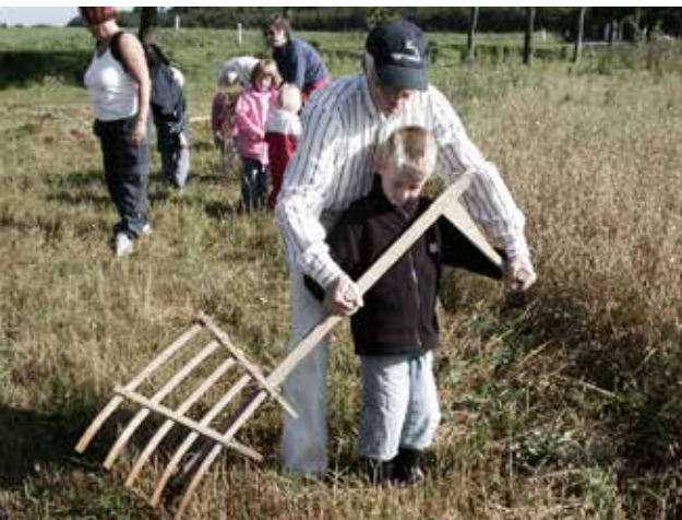
Fotos af aktiviteter med gamle arbejdsmetoder fra Give-Egnens Museum og daginstitutionen Grangården i Jelling.