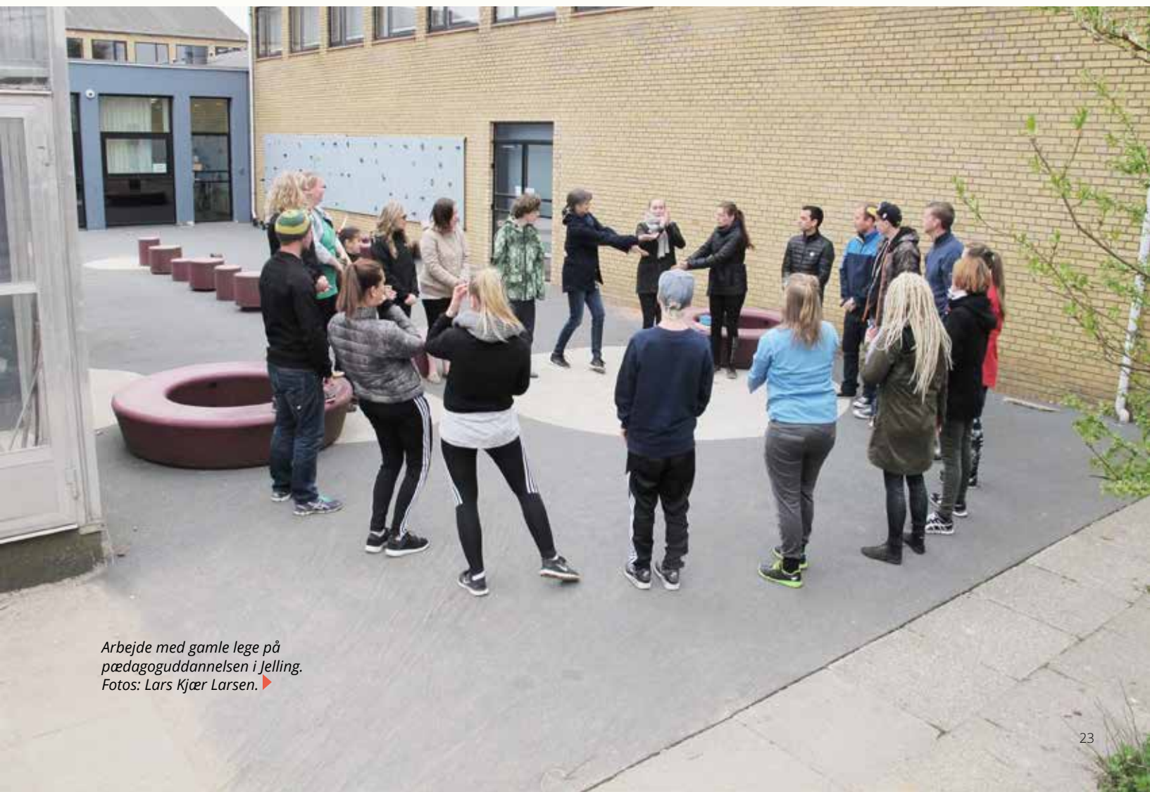
Arbejde med gamle lege på pædagoguddannelsen i Jelling. Fotos: Lars Kjær Larsen. ▶

Vi delte vores arbejdsperiode op i en uges introduktion, ca. halvanden uges projektarbejde og sluttede af med nogle travle fremlæggelsesdage, hvor de studerende fremlagde deres projekter for hinanden.