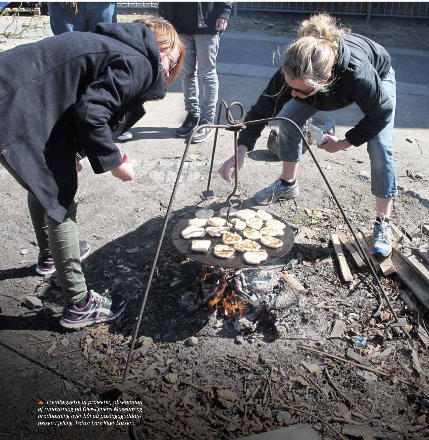
▲ Fremlæggelse af projekter, observation af rundvisning på Give-Egnens Museum og brødbagning over bål på pædagoguddannelsen i Jelling.