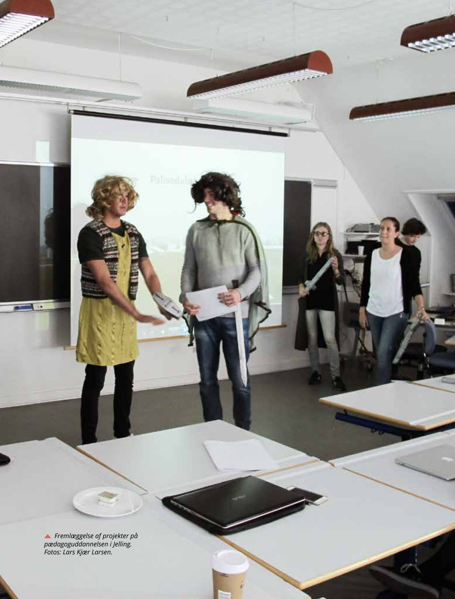
▲ Fremlæggelse af projekter på pædagoguddannelsen i Jelling.