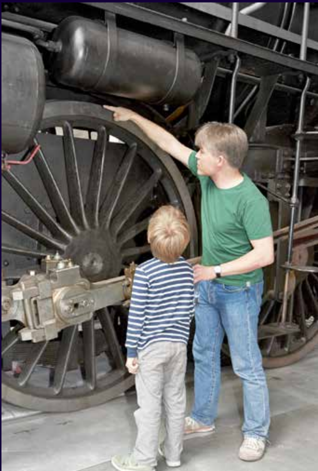
Danmarks Jernbanemuseum.