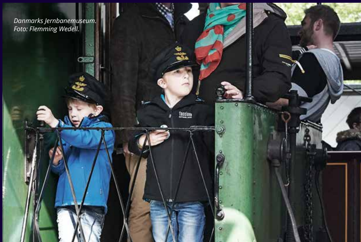
Danmarks Jernbanemuseum. Foto: Flemming Wedell.

"Vi så i vores afprøvning, hvor stor betydning netop kommunikationen havde. Pædagogen læste hurtigt vores manual...og gennemførte skattejagten præcis, som vi havde tiltænkt det at foregå." "Derudover så vi vigtigheden af god kommunikation mellem pædagogen og børnene. Pædagogen formåede nemlig, at holde børnene fanget og koncentreret omkring opgaverne ved at formulere sig på en sjov, fængende og humoristisk måde. Han kommunikerede både med sin krop og sine ord, at det, de skulle til at i gang med, var spændende – og han kommunikerede på et niveau, hvor børnene kunne være i øjenhøjde med ham samt forstå og relatere sig til de eksempler og talemåder, han brugte."