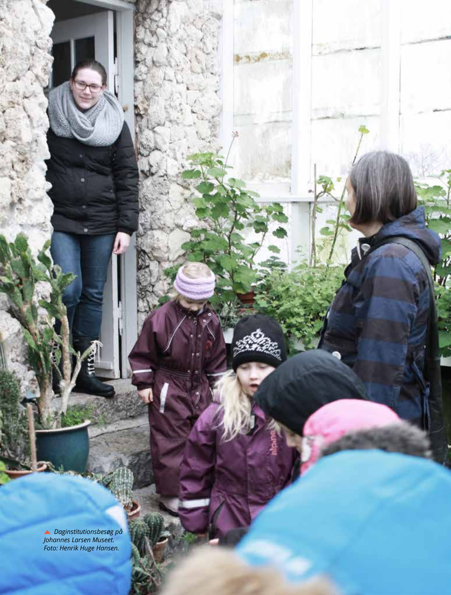
▲ Daginstitutionsbesøg på Johannes Larsen Museet.