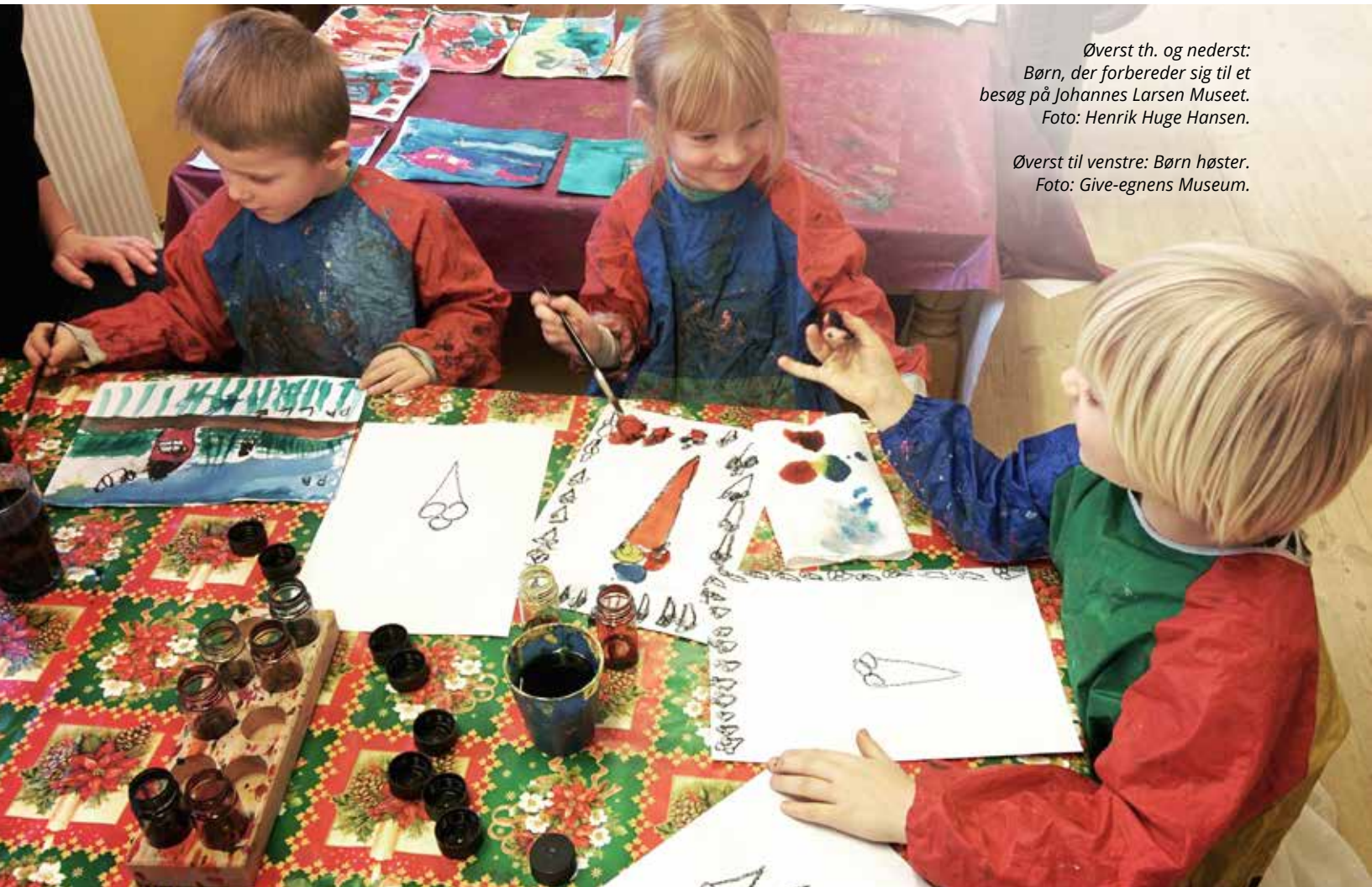
Øverst th. og nederst: Børn, der forbereder sig til et besøg på Johannes Larsen Museet.