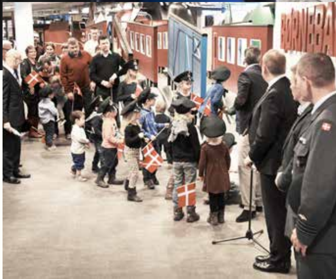
▲ Danmarks Jernbanemuseum.