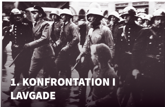
1. KONFRONTATION I LAVGADE