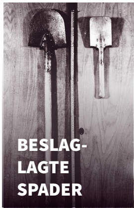
BESLAG- LAGTE SPADER