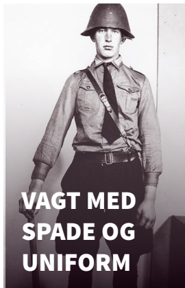
VAGT MED SPADE OG UNIFORM