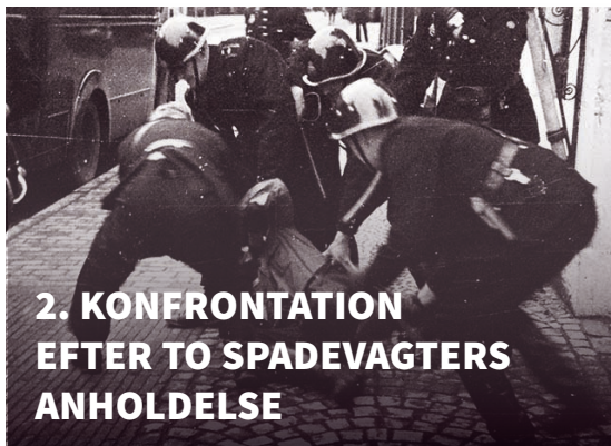
2. KONFRONTATION EFTER TO SPADEVAGTERS ANHOLDELSE

Kl. 14 → Nazisterne mødes syd for Haderslev.