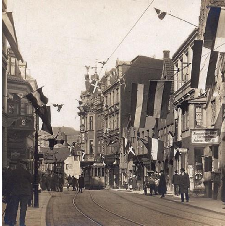
Der flages i Flensborg.

Det tyske flag var i 1920 sort, hvidt og rødt.