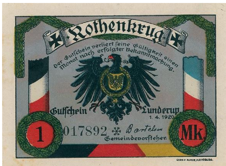
Nødpengeseddel fra Rødekro. Kilde fra Rigsarkivet Aabenraa.