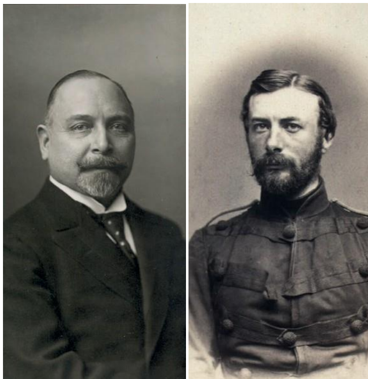
Tv. Statsminister C. Th. Zahle (1866-1946).

Er det vigtigt, at der er lige mange af hvert køn i Folketinget? Forklar hvorfor / hvorfor ikke?