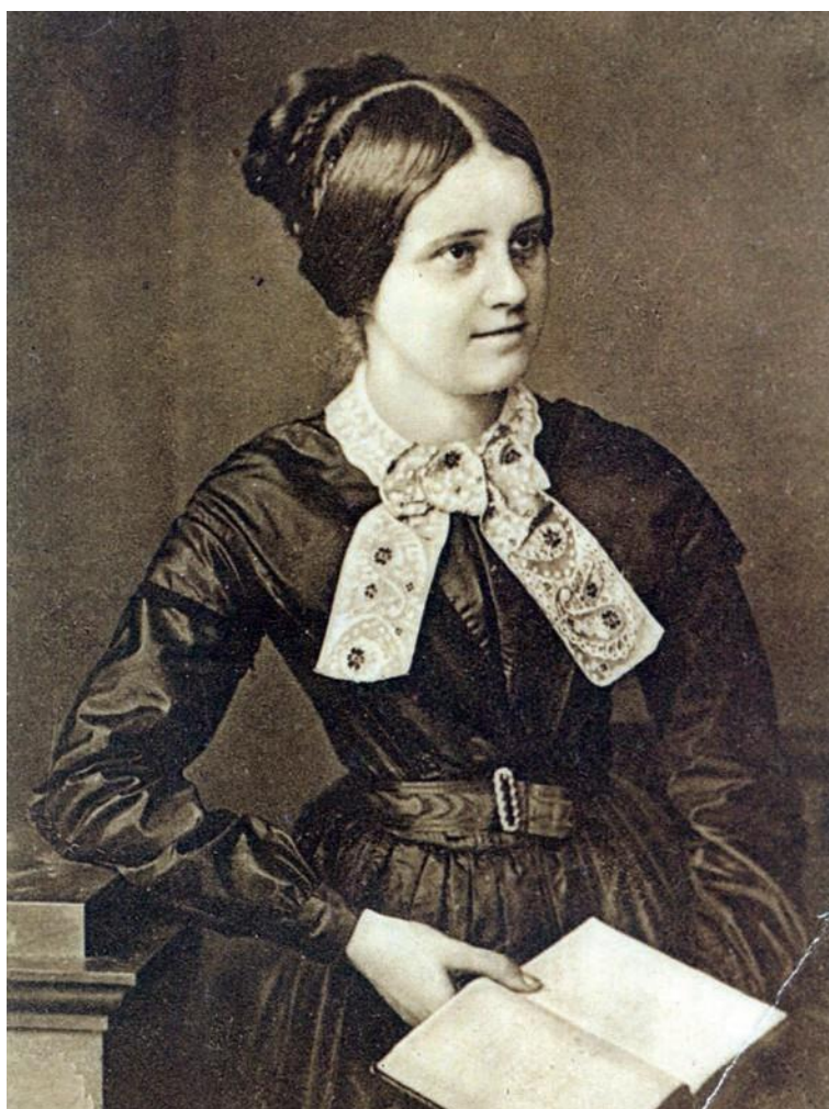
Mathilde Fibiger (1830-1872).