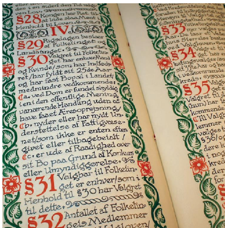
Grundloven fra 1915.

Kender du andre eksempler på, at der er forskel på vores muligheder og rettigheder i dag på grund af vores køn?