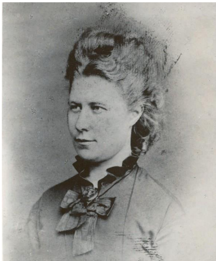
Nielsine Nielsen (1850-1916).

Hvorfor tror du, at nogle mænd protesterede mod at give kvinder adgang til uddannelse og jobs?