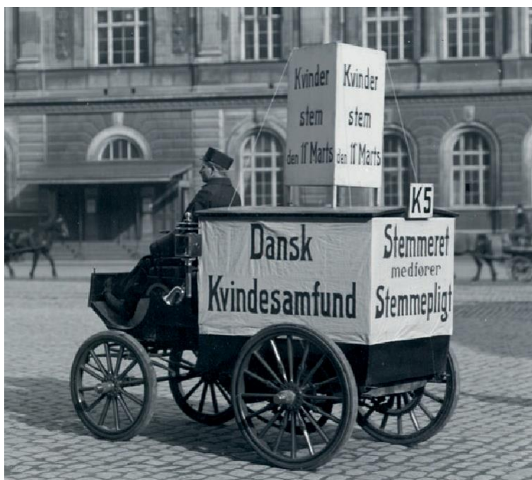
Kampagnevogn fra Dansk Kvindesamfund, kommunalvalget 1913.

I denne bog kommer du til at møde et par af de kvinder, som turde kræve, at de blev ligeværdige med mænd i samfundet. Du vil møde mænd, som støttede kvinderne i deres krav – og mænd, som bestemt ikke ønskede, at kvinderne fik de samme muligheder, som de selv havde.