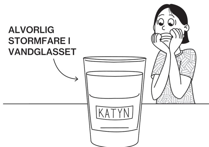
Billede 1. [Figur tekst]

I denne artikel undersøger vi, hvordan et historieemne betegnet følsomt og omstridt i én kontekst (polsk) overføres, gøres meningsfuldt og vedkommende i en anden (dansk 8. klasse). Vi har fulgt afprøvningen af et forløb om Katyn-massakren i Polen i 1940 i en dansk 8. klasse og spørger, hvilke didaktiske forudsætninger et sådant forløb forudsætter, når/hvis elever skal opleve det som meningsfuldt og vedkommende uden (måske) at opleve det følsomme og omstridte som et indre subjektivt anliggende. Vi diskuterer endvidere betydningen af at beskæftige sig fagdidaktisk i historie med oplevelser som hhv. indre subjektive vs. ydre objektive anliggender. Vores pointe er, at de to implicerer forskellige didaktiske valg ift. tilrettelæggelse og håndtering af undervisningen på en for eleverne meningsfuld og vedkommende måde.